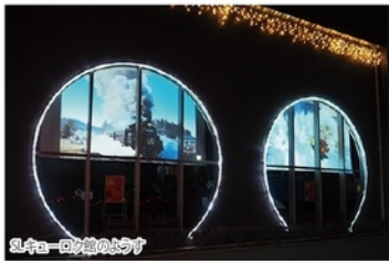
SLキューロク館の様子

例年行っている真岡駅4F窓ガラスへのマッピングに加え、今年は新たに真岡駅舎の壁面にもマッピングを実施しています!駅舎のイルミネーションとのコラボレーションをお楽しみください。また、キューロク館のマッピングでは今回、今年のSLフェスタ写真展に応募された作品も上映されています。-真岡市情報センター(有限会社ヨコタの指定管理施設)