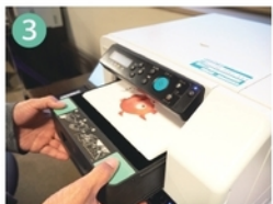
上の機械で印刷します。きれいに印刷されていて感動!