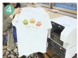
オリジナルのTシャツができました! タオルやTシャツバックにも印刷できます。

早くて簡単にできました! アイソプリントと違って、繊維一本一本に印刷されているので引っ張っても割れないし、お店のTシャツみたいで驚きました(スタッフ)